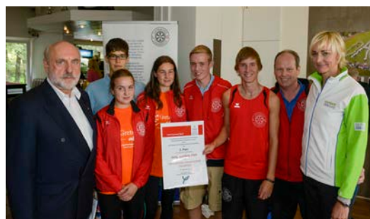
2. Platz 2013 LG Leichtathletik Osnabrück