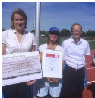
1. Platz 2014 TherESIen Gymnasium Ansbach "Integrative, Olympische Sommerspiele"